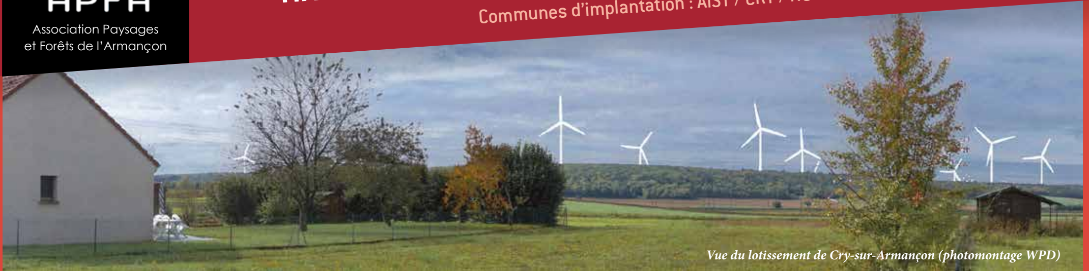
Vue du lotissement de Cry-sur-Armançon (photomontage WPD)

Communes d'implantation : AISY / CRY / NUITS - Promoteur : WPD