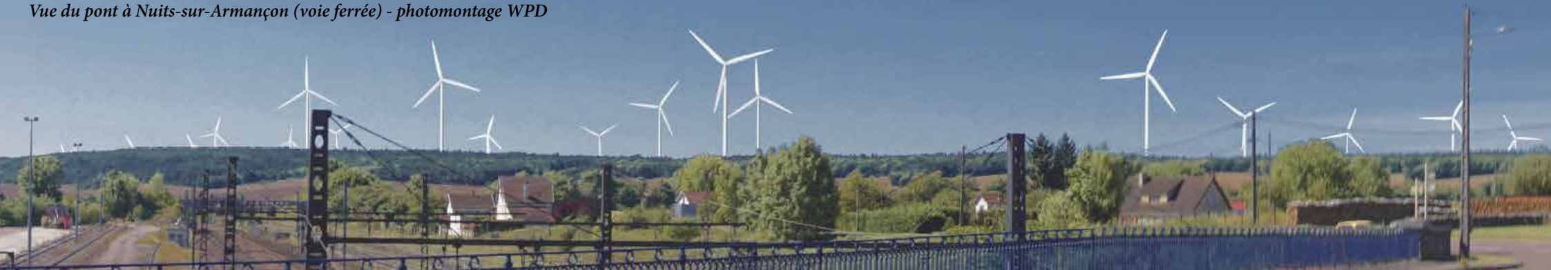
Vue du pont à Nuits-sur-Armançon (voie ferrée) - photomontage WPD