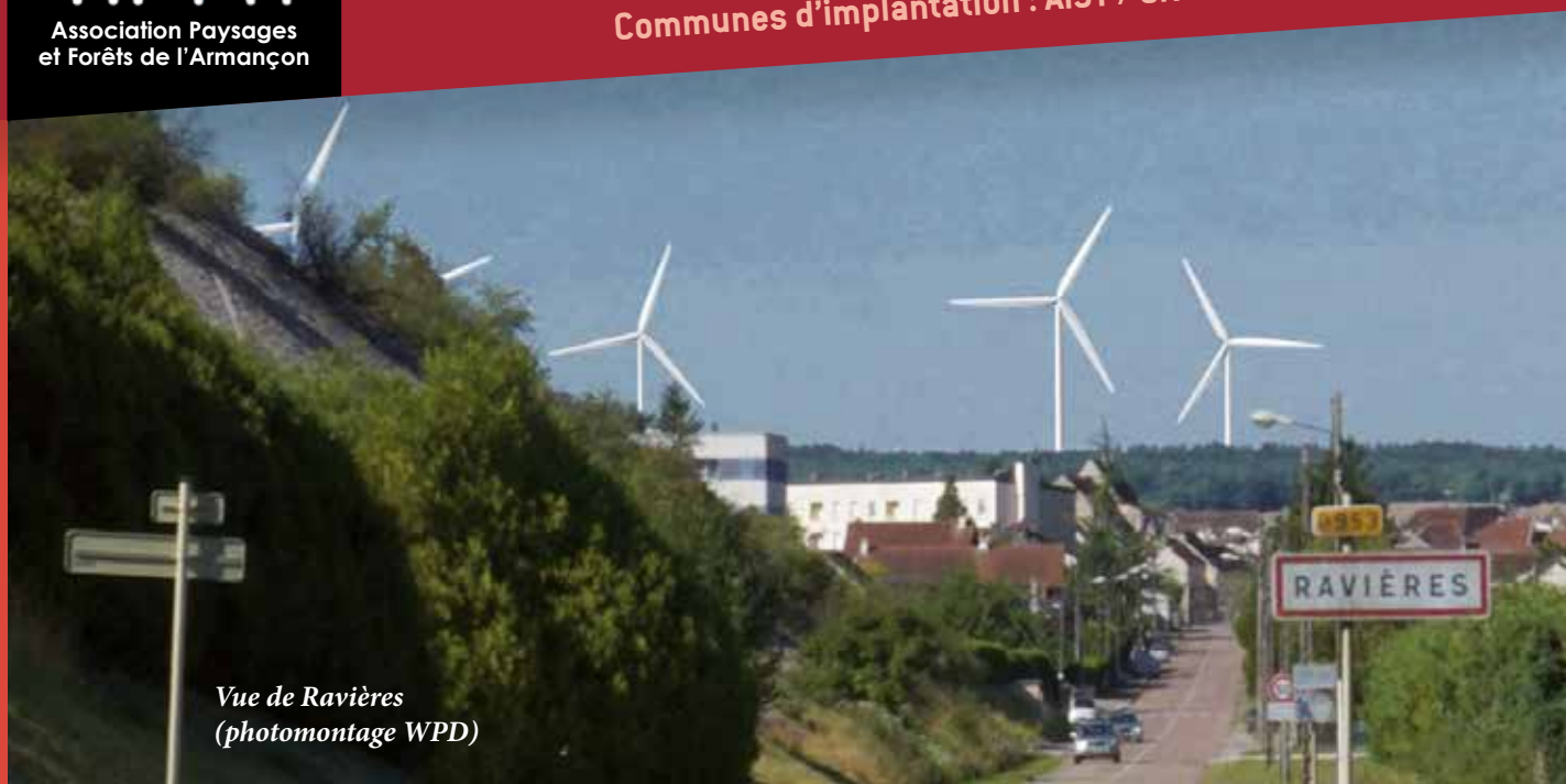
Vue de Ravières (photomontage WPD)

Communes d'implantation : AISY / CRY / NUITS (Promoteur : WPD)